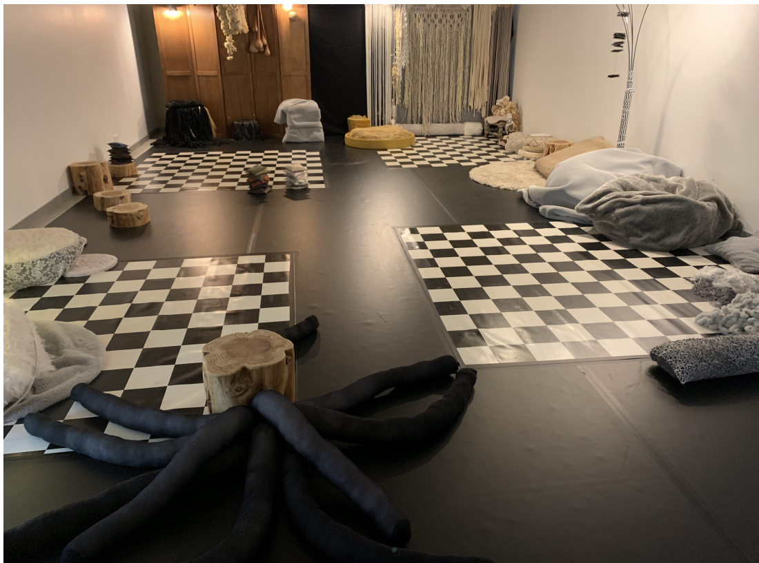
Vue depuis la penderie